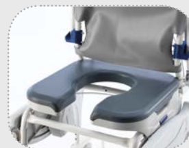
Seduta e schienale