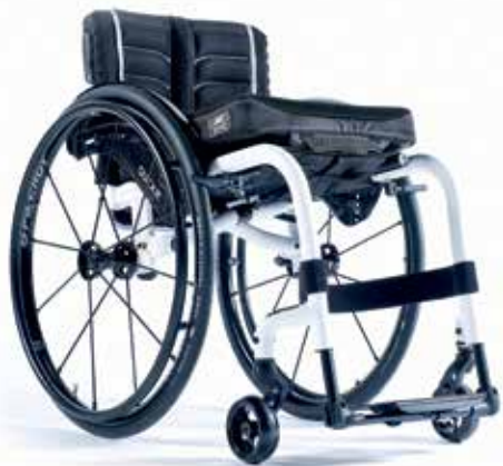
XENON ® FF LA PIÙ LEGGERA