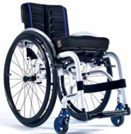
XENON ® HYBRID LA PIÙ RESISTENTE