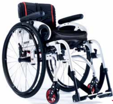
XENON ® SA LA PIÙ ECLETTICA